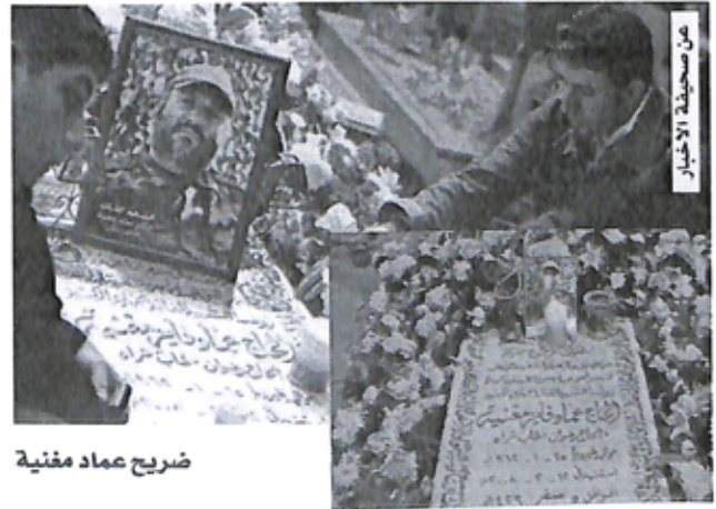
ضريح عماد مغنية