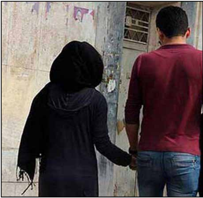
زواج في الخفاء، موقع اللبنانية.

تحفظات، أبرزها ما يتعلّق بالأحوال الشخصية. كما يتناقض هذا الخطاب مع الحق في الكرامة الجسدية، وحرية اتخاذ القرار بشأن العلاقات الشخصية، والحق في الحماية من الاستغلال.